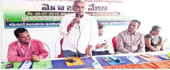
కార్యక్రమంలో మాట్లాడుతున్న ఎమ్మెల్యే మానుగుంట మహీధర్ రెడ్డి