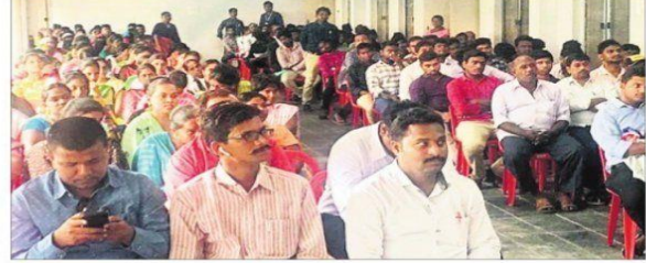
ఇంటర్వ్యూలకు హాజరైన విద్యార్థులు